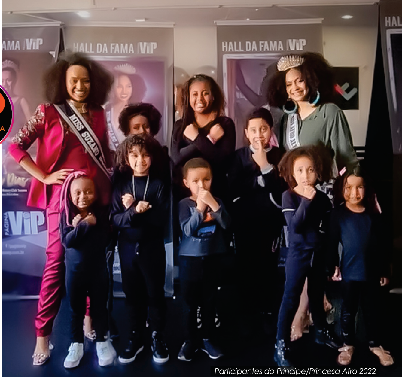
Participantes do Príncipe/Princesa Afro 2022

Os concursos infantis retornarão somente a partir de maio/2024.